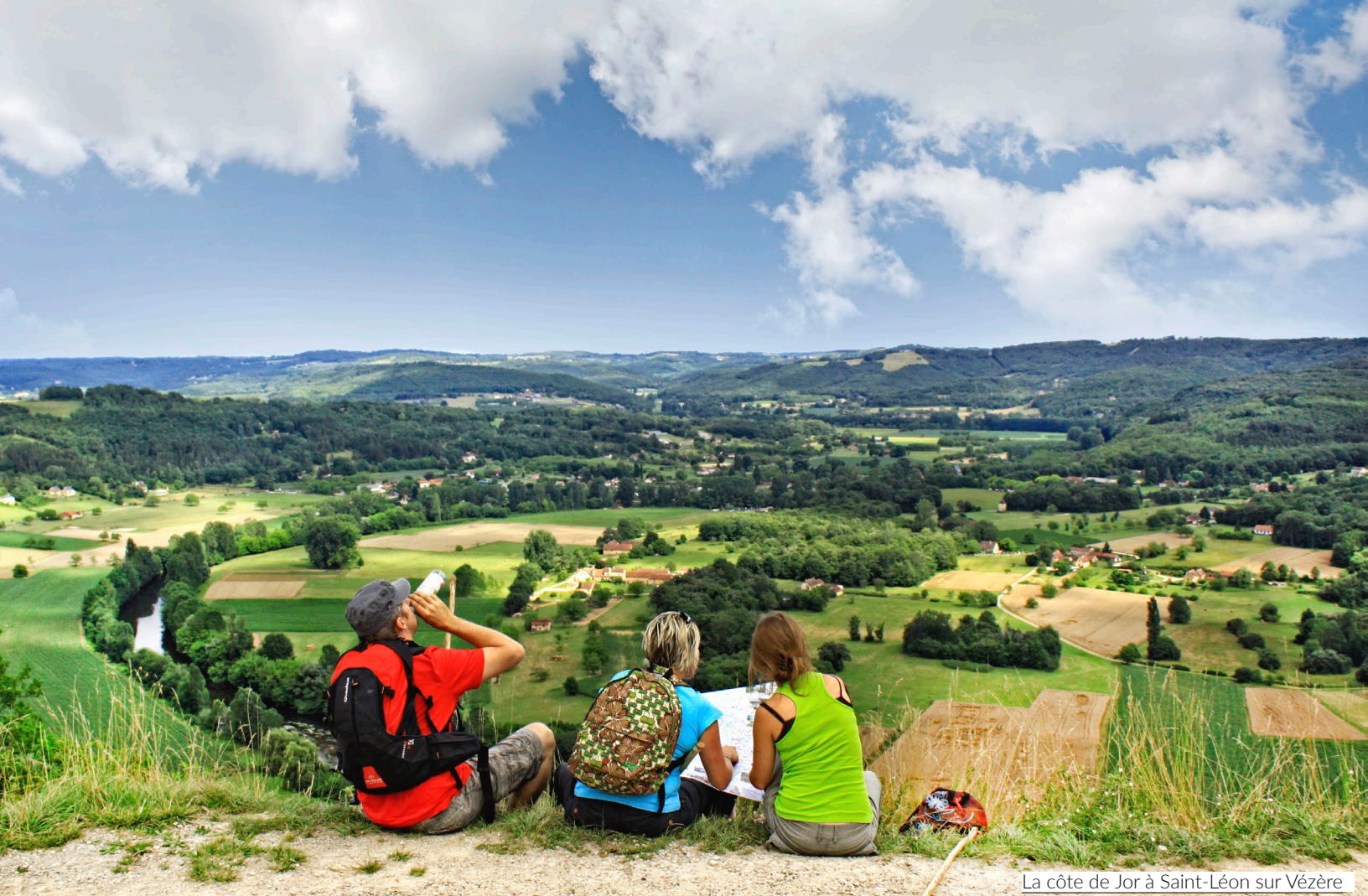
La côte de Jor à Saint-Léon sur Vézère