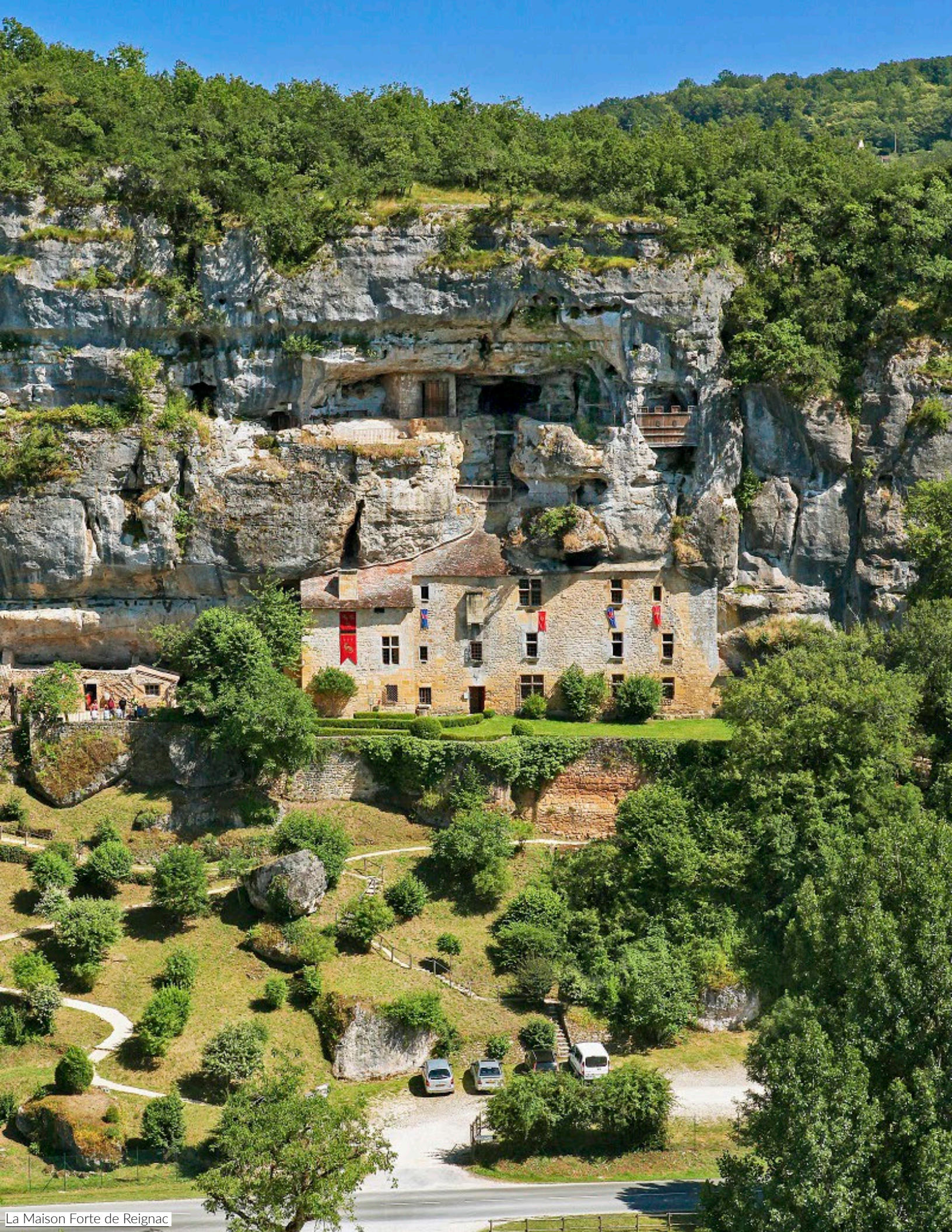
La Maison Forte de Reignac