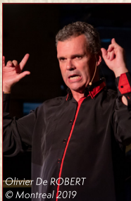
Olivier De ROBERT © Montreal 2019

Deux artistes que nous avons accueillis lors de nos précédentes soirées et que le public nous réclame souvent. Pour fêter les 25 ans du festival, ils ont carte blanche pour la clôture du festival. Ce sera la grande surprise !