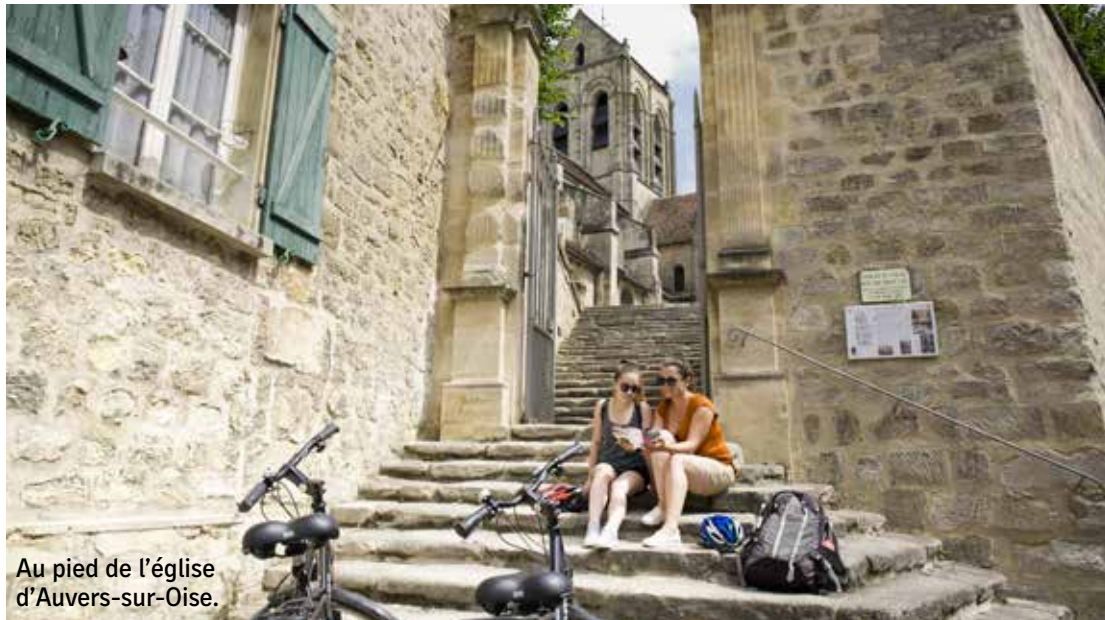
Au pied de l'église d'Auvers-sur-Oise.