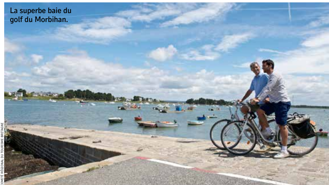
La superbe baie du golf du Morbihan.

• fondation-isle.e-monsite.com/ Où manger : • caviar-de-neuvic.com