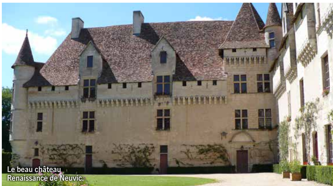
Le beau château Renaissance de Neuvic.