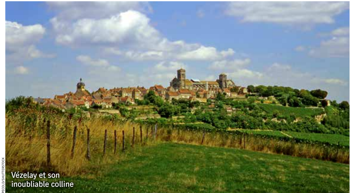
Vézelay et son inoubliable colline

• L'Auberge Ravoux, tél. : 01 30 36 60 60 ou maisondevangogh.fr