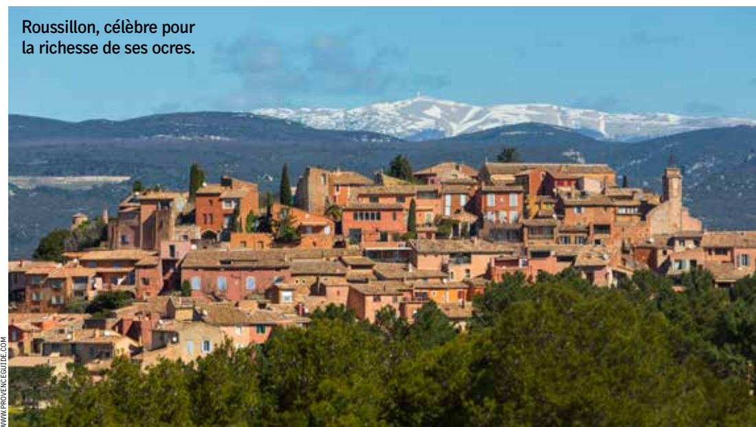
Roussillon, célèbre pour la richesse de ses ocres.